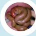
ตาใส่แว่น