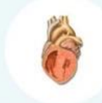
เส้นเลือดไม่ปิดหลังคลอด