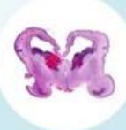
เลือดออกในโพรงสมอง