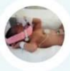
ปอดแลกเปลี่ยนออกซิเจนไม่ได้ ต้องช่วยหายใจ

ระยะการตั้งครรภ์ที่สั้นสุดก่อน 37 สัปดาห์ หรือที่เรียกว่า "คลอดก่อนกำหนด" ส่งผลให้เกิดอันตรายต่ออวัยวะสำคัญของร่างกายดังแสดงในภาพ บางรายอาจมีผลต่อการเจริญเติบโตและพัฒนาการที่ผิดปกติเมื่อโตขึ้น