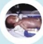
ข้อก บิดเข่ารุนแรง